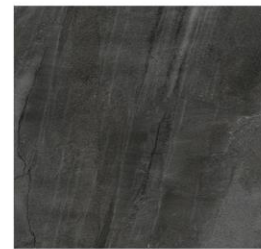
SAVAGE DARK 120X120 polished