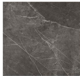
AGED DARK NATURE 120X250 (6) (A)